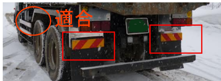
平成23年9月以降製作車