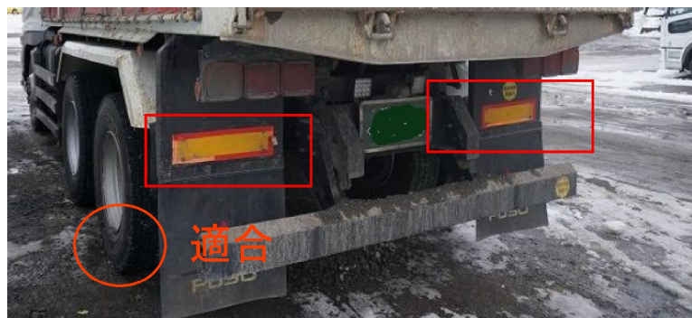
平成23年8月以前製作車