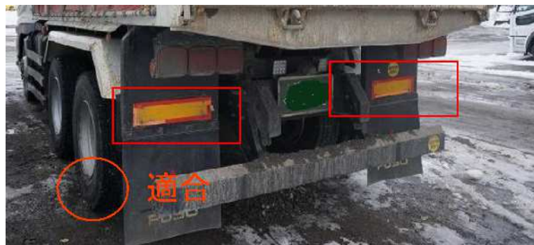
平成23年8月以前製作車