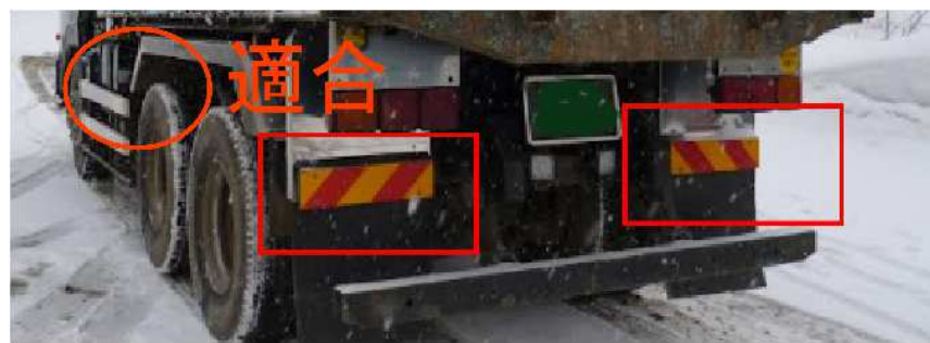
平成23年9月以降製作車