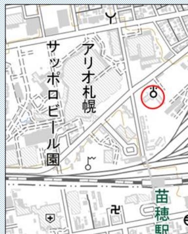
(地図赤丸) 北海道開発局研修センター

3 開催方法 会場（上記2）及び オンライン（Microsoft Teamsを利用） *会場での受講の場合、受講者用の駐車 スペースはありません。公共交通機関 又は近隣の有料駐車場をご利用ください。